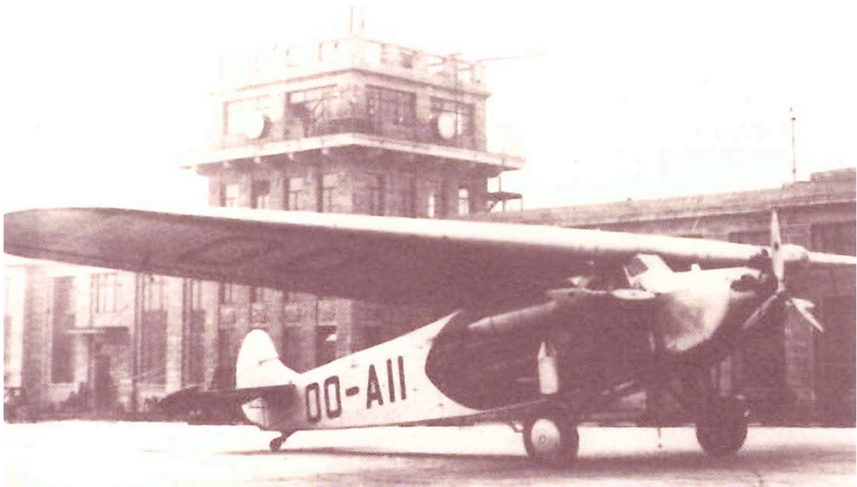
Un trimoteur Fokker qui servit aussi sur la ligne Belgique-Congo.