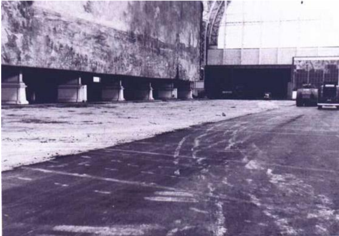
Asfaltwerken in 1971. Aan de linkerkant, het grote fresco van de Slag om de IJzer