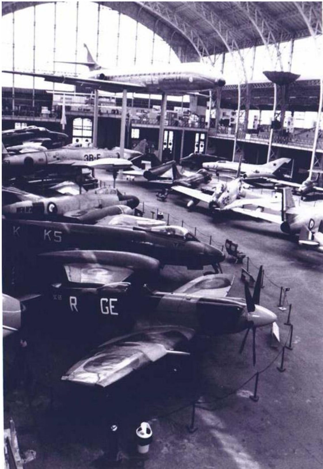
Sabena Caravelle, geplaatst op drie steunpilaren in 1986