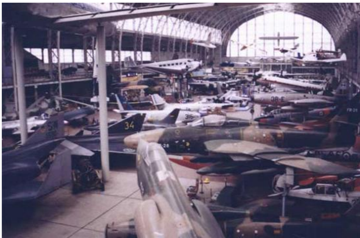
Op het voorplan: F-104G, F-84F, RF-84F, Hunter, Meteor XI en F-84G