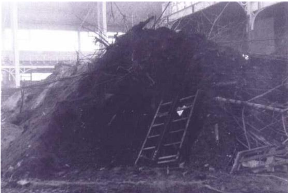
De grote hal in 1968, stortplaats van het Jubelpark