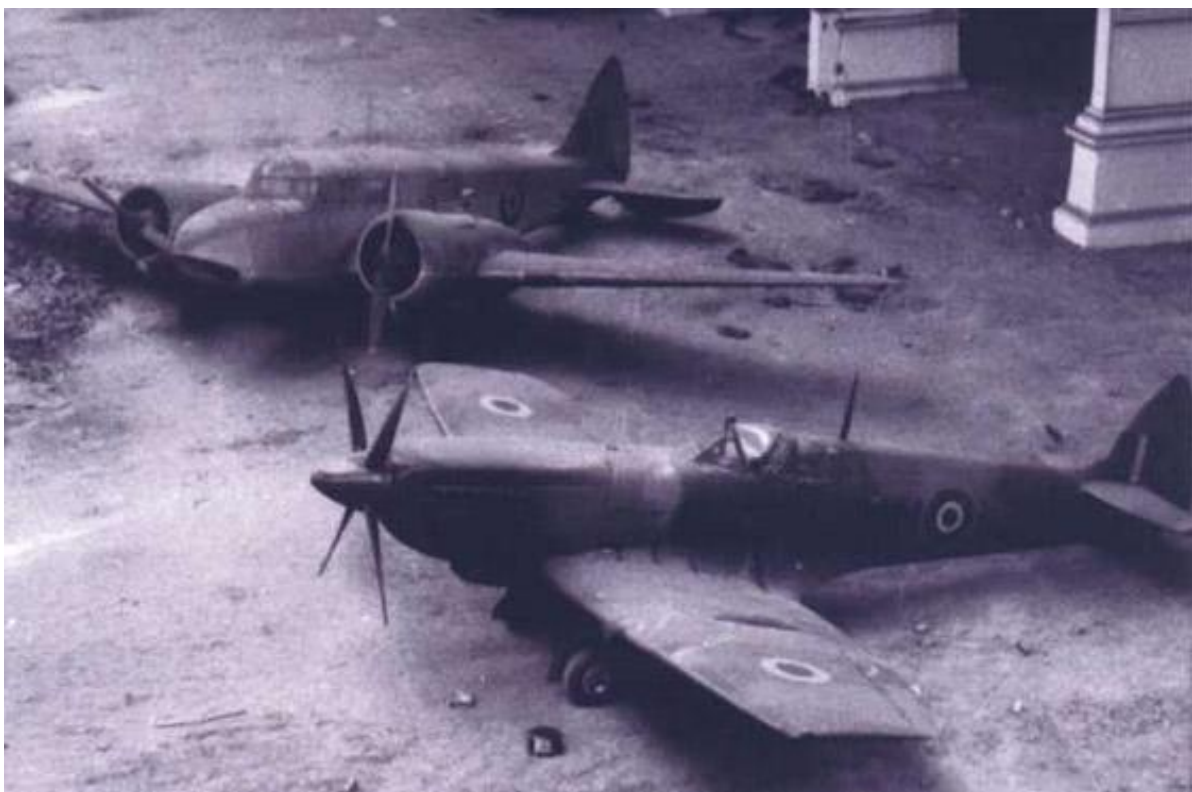
De eerste vliegtuigen; Spitfire IX en Oxford