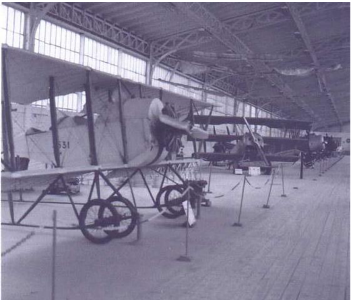
Oost galerij: vliegtuigen van 1914-1918 Caudron GIII en replica van de Fokker driedekker van de Rode Baron.