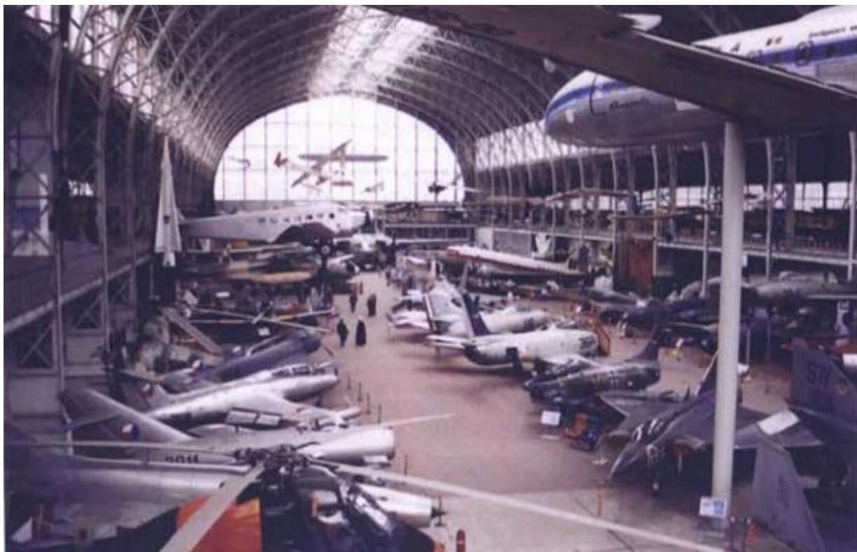
Links de Sovjet- en Europese vliegtuigen In het centrum: allerlei jachtvliegtuigen onder de Caravelle Vooraan: De transportvliegtuigen