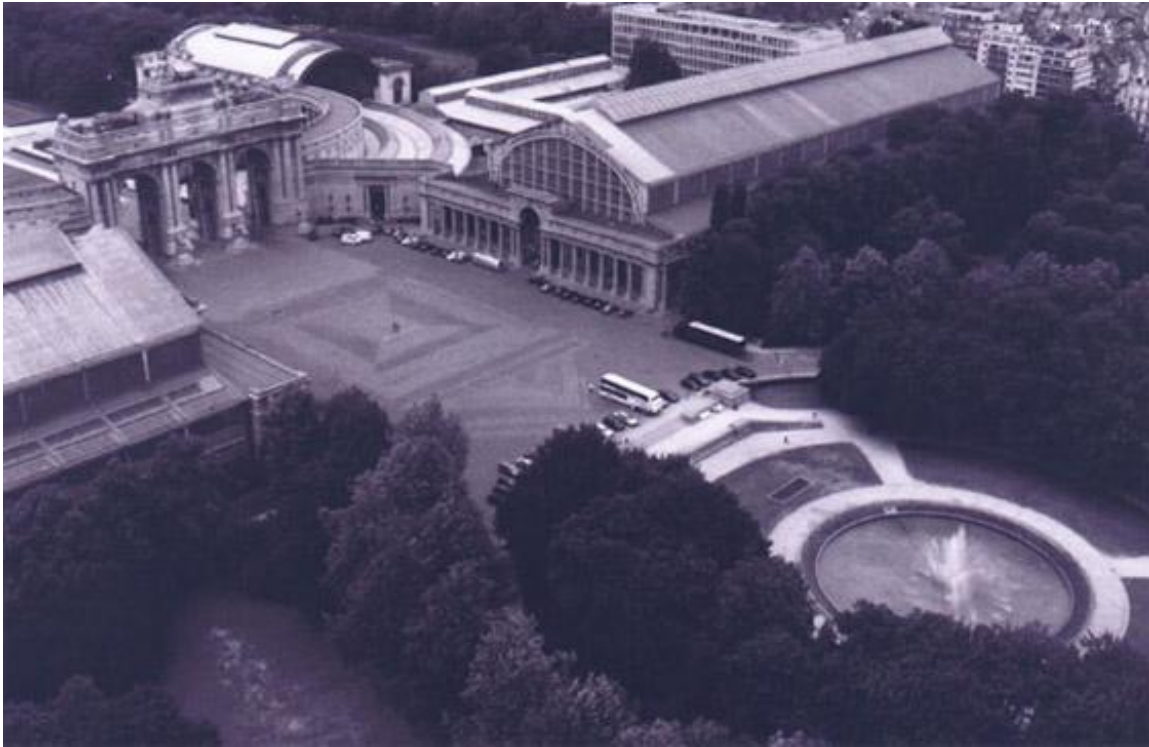
De grote hal van het Luchtvaartmuseum, gebouwd door de architect Bordiau, op vraag van koning Leopold II.