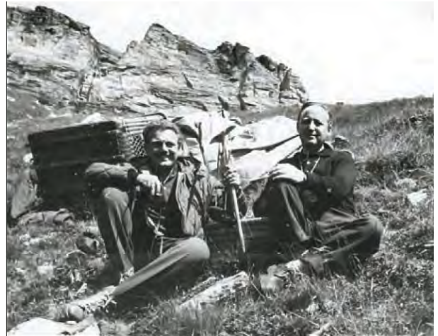
Na de noodlanding