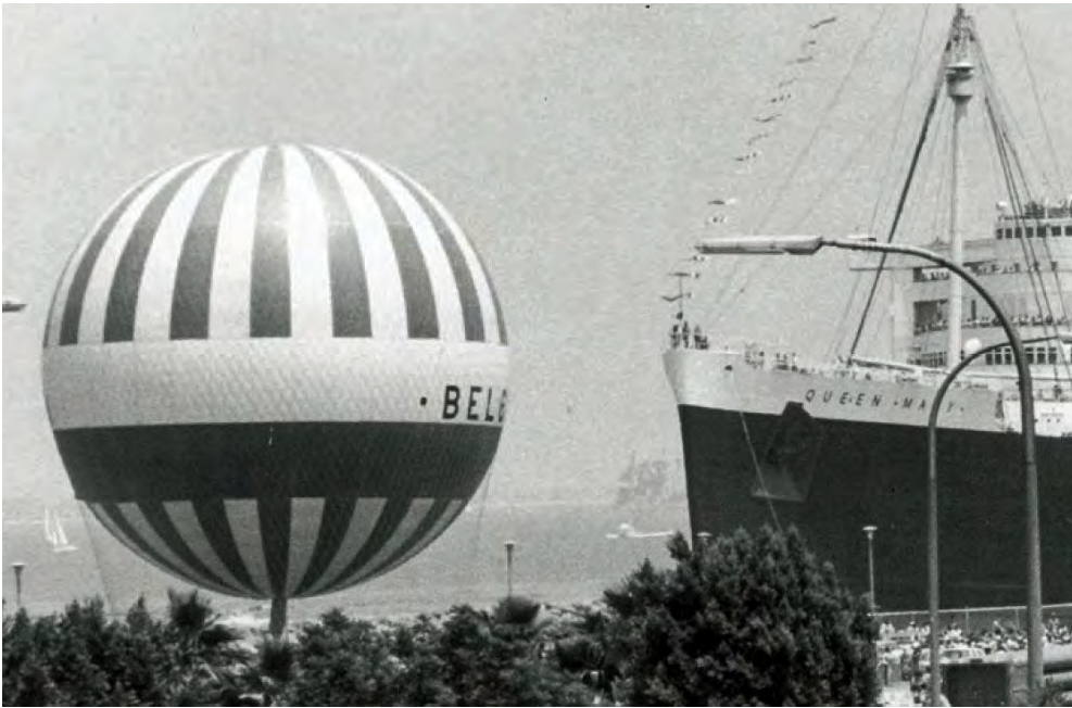
Gordon Bennet Cup in Long Beach met de Queen Mary op de achtergrond