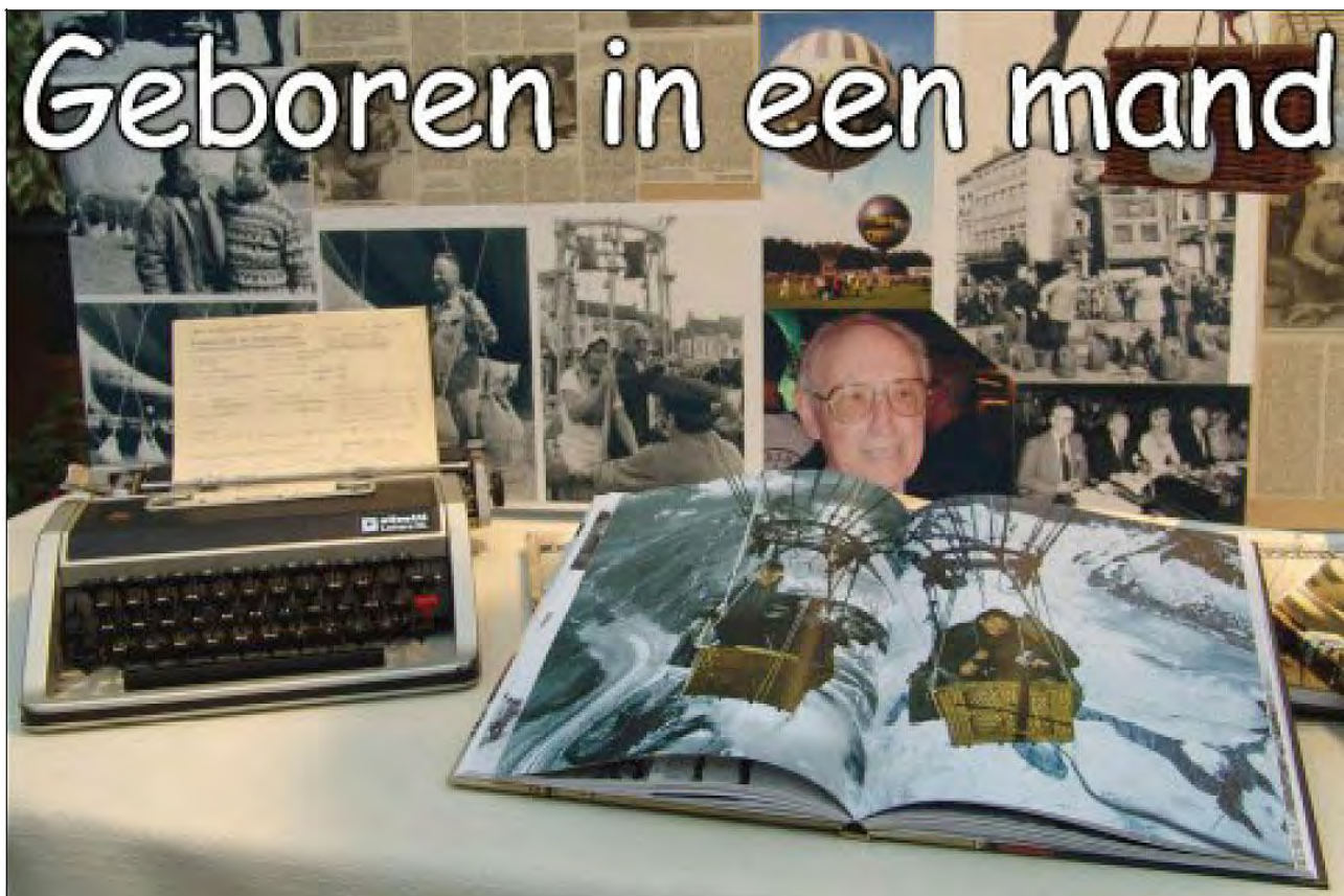
Het werk dat na zijn dood werd uitgegeven