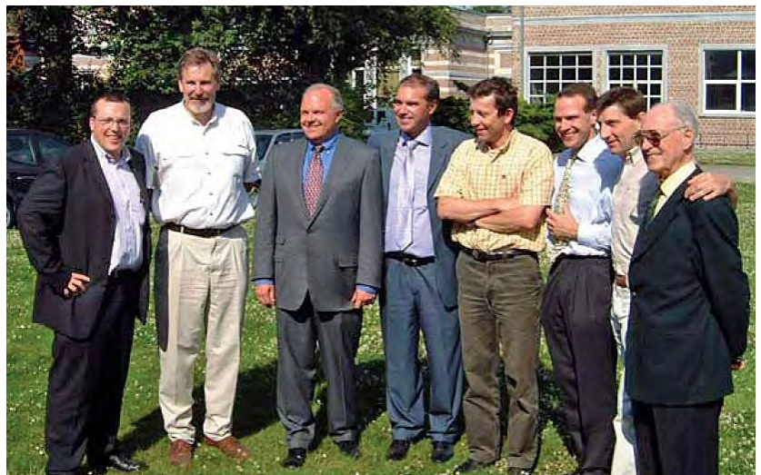
Ontmoeting met Steve Fosset (grijs kostuum)