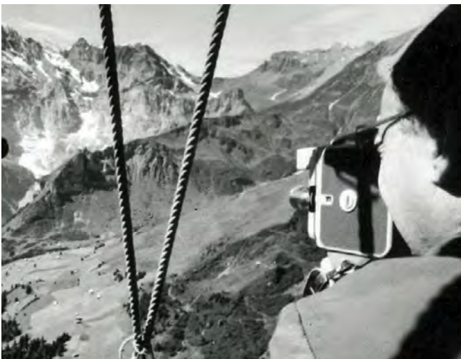
Opstijging van Muerren, aan de voet van de Jungfrau