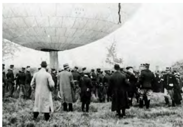
Ernest Demuyter met zijn kandidaat-ballonvaarders